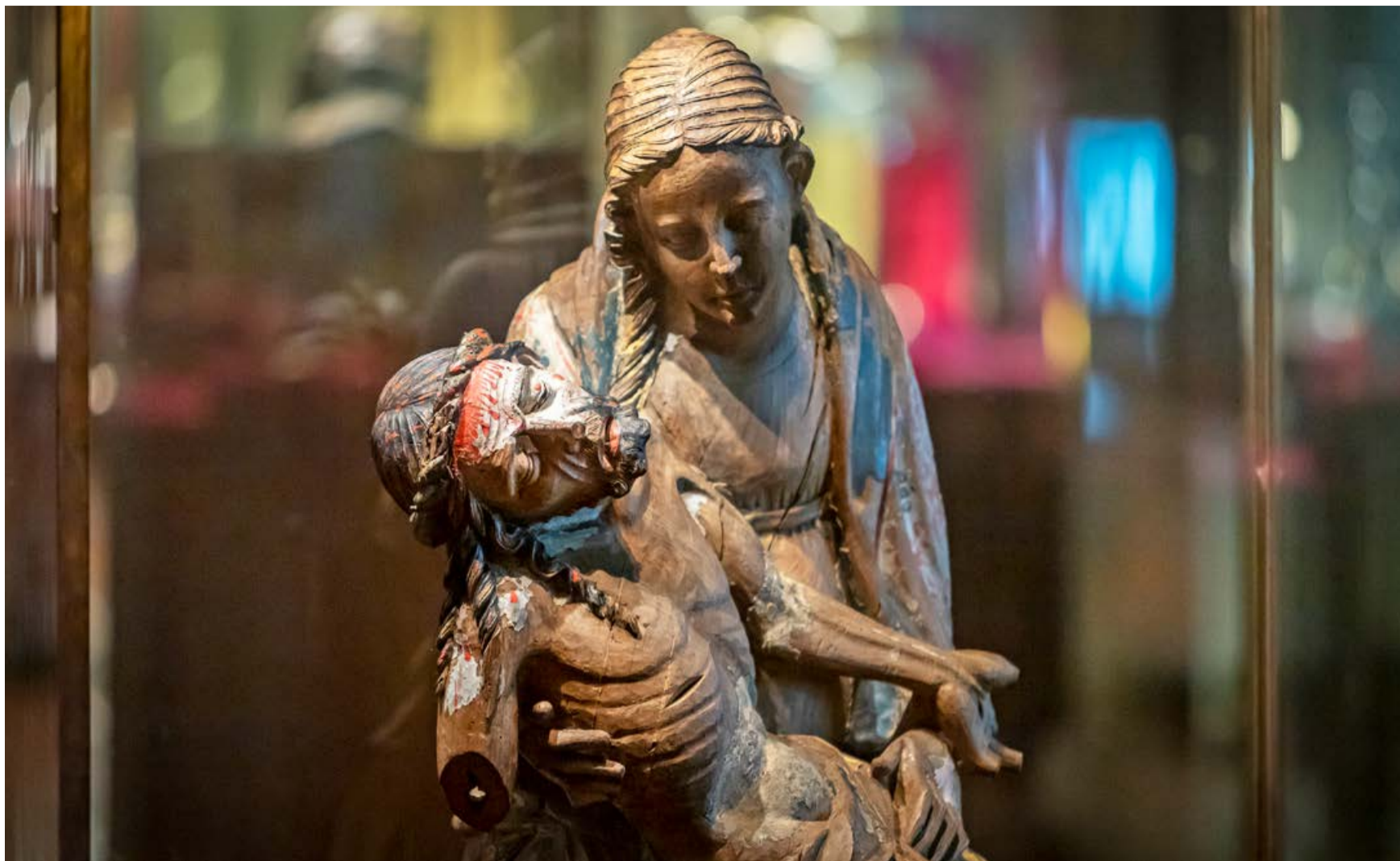
Den rörande Pietà-skulpturen som visas i Domkyrkomuseet är från slutet av 1300-talet.