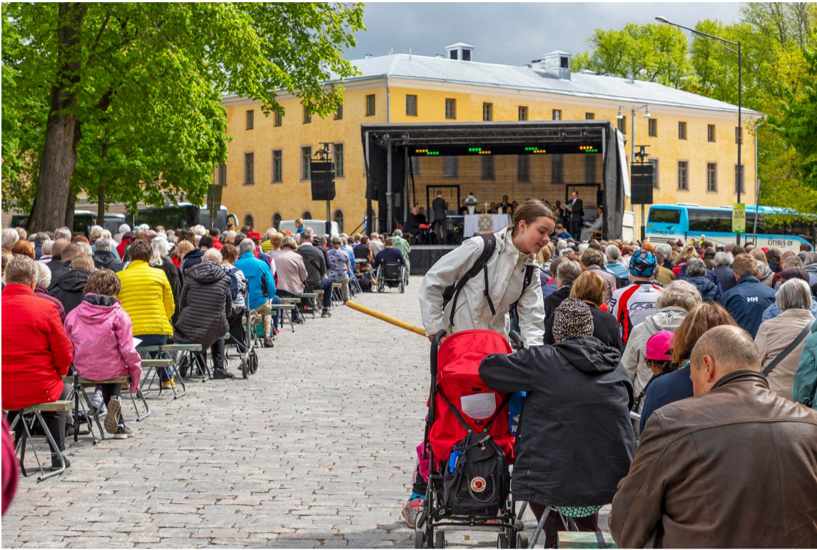
Suvivirsikirkossa pääsee laulamaan tuota suomalaisille niin rakasta virttä suomeksi, ruotsiksi ja Turun murteella.